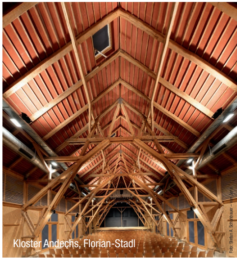
Kloster Andechs, Florian-Stadl