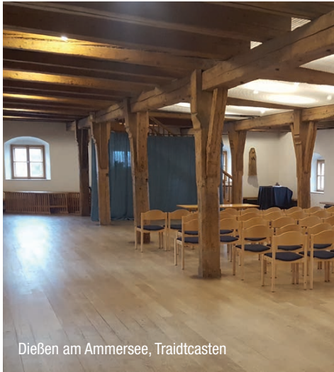
Dießen am Ammersee, Traidtcasten