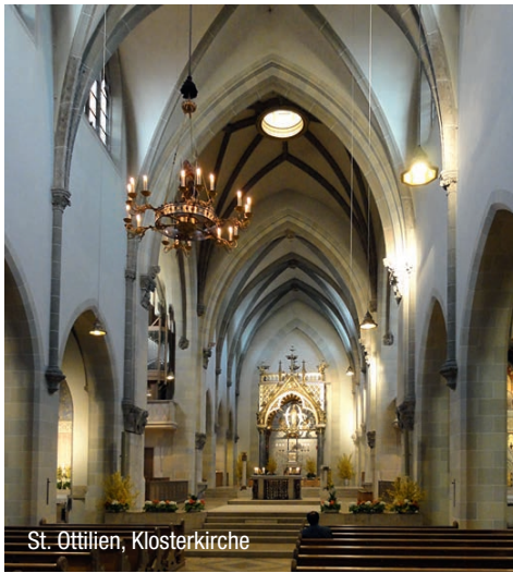
St. Ottilien, Klosterkirche