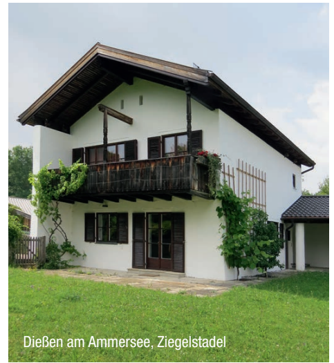
Dießen am Ammersee, Ziegelstadel