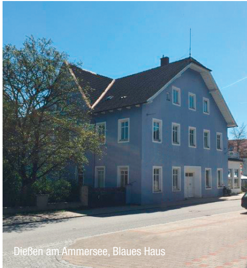
Dießen am Ammersee, Blaues Haus